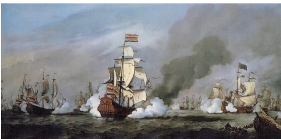
De Slag bij Kijkduin, 21 augustus 1673 Door Willem van de Velde de Jonge, 1687. De "Gouden Leeuw" vlaggenschip van Cornelis Tromp, in gevecht met de nieuwe "Royal Prince" met de vlag van Spragge in de top.

De Franse aftocht bood Banckert een buitenkans: hij zonderde een tiental schepen van zijn eskader af om de Fransen verder in de gaten te houden, en ging met zijn overige schepen op zoek naar De Ruyter. Deze was met de middentocht in gevecht met het eskader van Prins Rupert. De komst van de regen was met een verandering van de windrichting gepaard gegaan en daardoor was de loef niet langer voor het eskader van De Ruyter. De Ruyter en zijn bijzonder ervaren vlagofficieren Aert van Nes, Johan de Liefde en Jan van Nes wisten daar in een zeeslag mee om te gaan, omdat zo iets natuurlijk wel meer gebeurde. De Engelse vlagofficieren hadden echter veel minder praktijkervaring en ondervonden dientengevolge de grootste moeilijkheden om hun linie bijeen te houden toen de wind van richting was veranderd. De Ruyter profiteerde daar onmiddellijk van en drong met zijn eskader als een wig tussen de Engelse schepen in verscheidene vijandelijke schepen dreigden daardoor van de hoofdmacht afgesneden te raken.